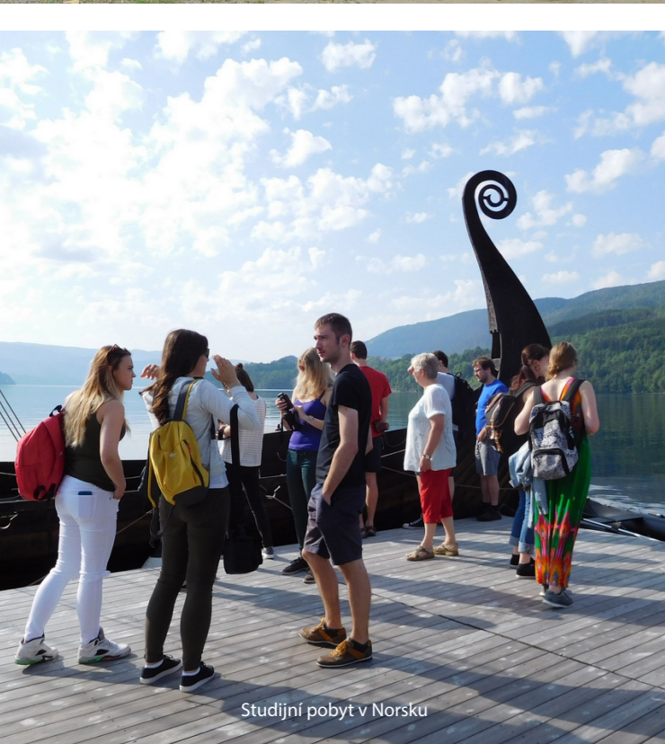
Studijní pobyt v Norsku